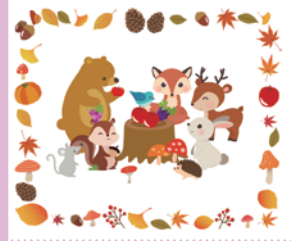
秋 (デザイン番号 G0413-01)