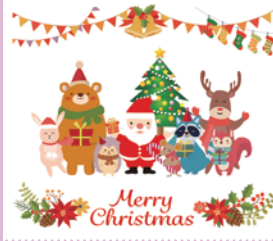
冬 (デザイン番号 G0414-01)