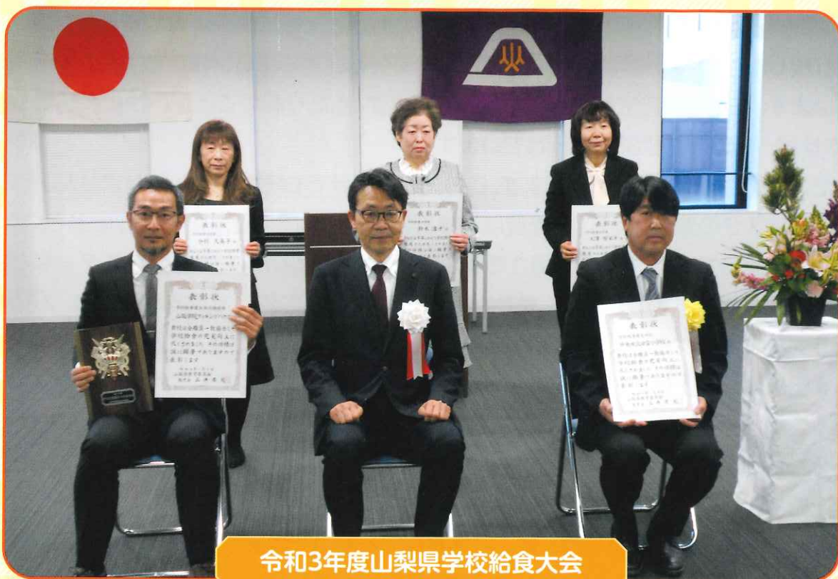
令和3年度山梨県学校給食大会